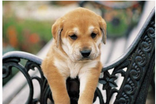
Bildtext som beskriver fotot eller illustrationen.

Med hjälp av ett nyhetsbrev kan du sprida speciell information till en viss målgrupp. Det kan faktiskt vara ett